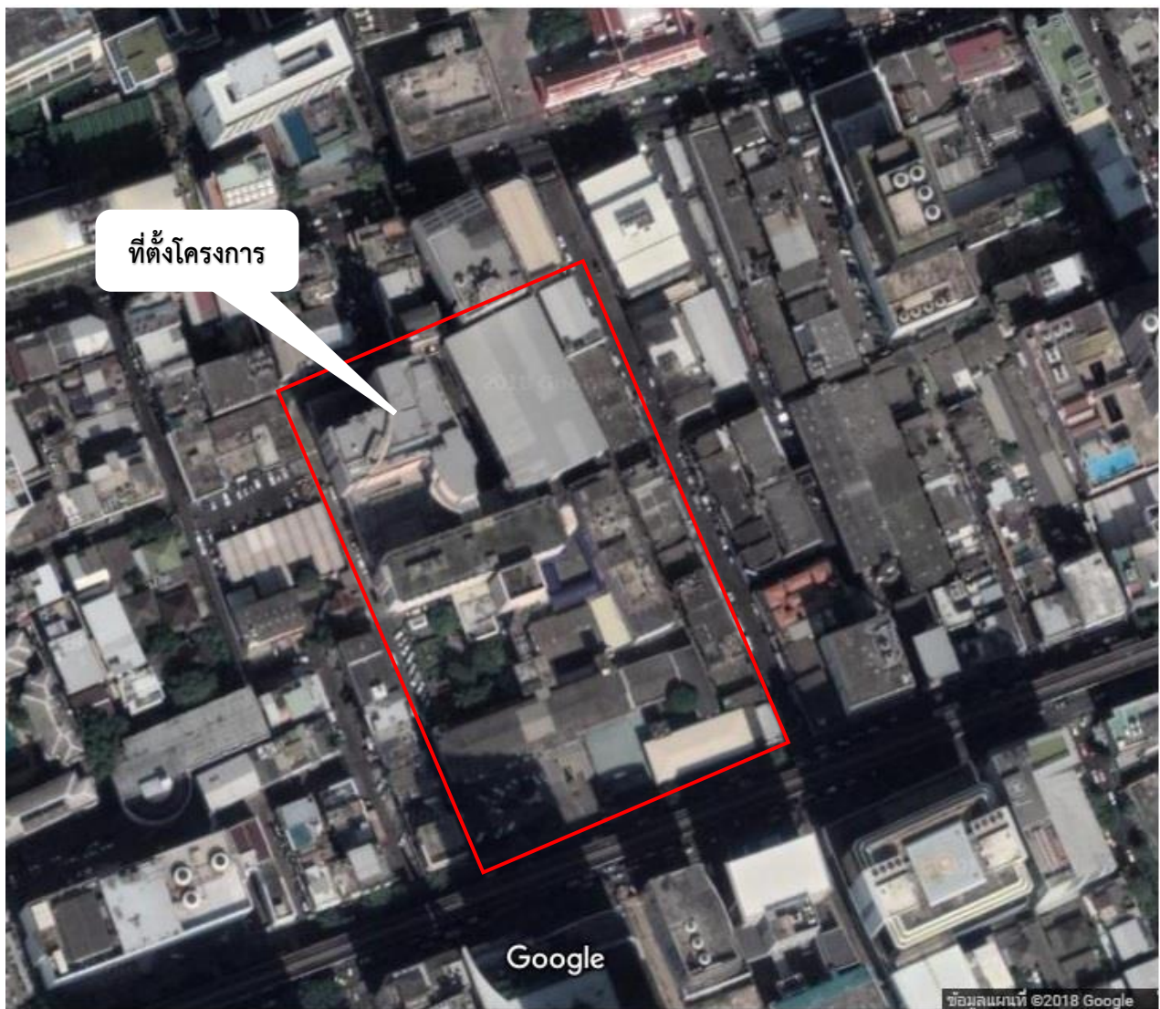
รูปภาพ 1-1 แผนที่โครงการ

8.3 ที่ตั้งโครงการ โรงพยาบาลกรุงเทพคริสเตียน ตั้งอยู่เลขที่ 124 ถนนสีลม แขวงสุริยวงค์ เขตบางรัก จังหวัดกรุงเทพมหานคร ก่อสร้างเมื่อปี พ.ศ.2478 จนถึงปัจจุบัน มีจำนวนเตียงผู้ป่วยค้างคืนทั้งหมด 244 เตียง ดังแสดงในรูปภาพ 1-1